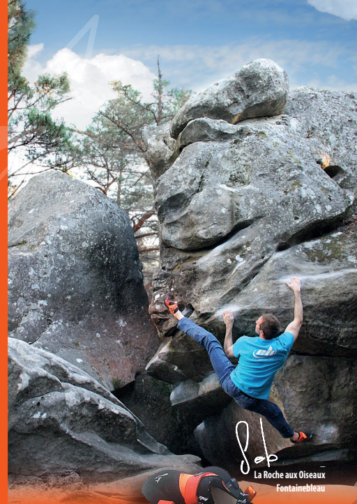
La Roche aux Oiseaux Fontainebleau

Flexibel und sehr asymmetrisch ist der Split ein sportlicher und vielseitiger Schuh. Er kann als Einzelschuh (ein halbes Paar) gekauft werden, und somit, wenn nötig, mit verschiedenen Grössen für den linken und den rechten Schuh verkauft werden.